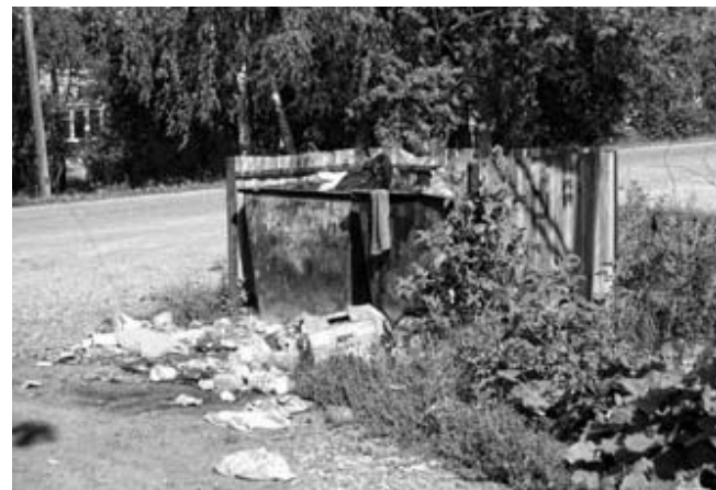
Угол ул. Молодежная — пер. Садовый.