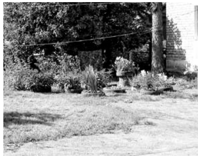
Двор дома №24, ул. Центральная.