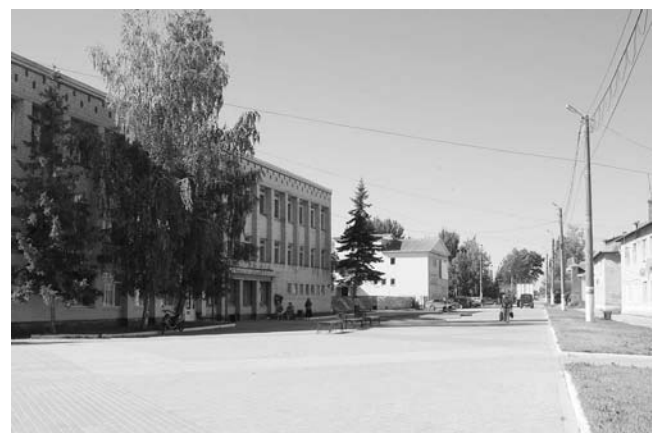
Площадь в райцентре.