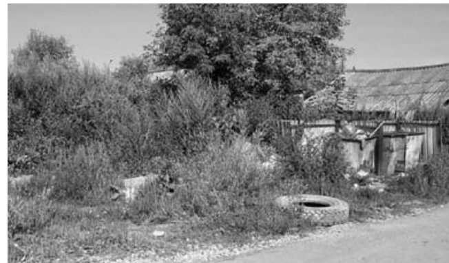
Помойка у дома №49, ул. Комсомольская.